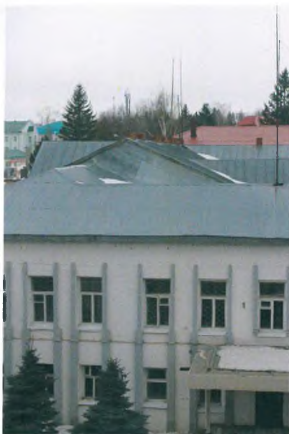
Крыша и кровля здания РОВД