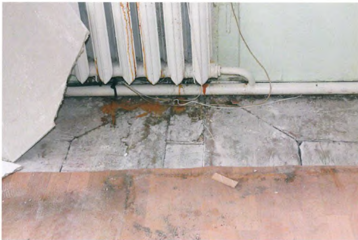
Дощатый пол с фризом в помещении второго этажа