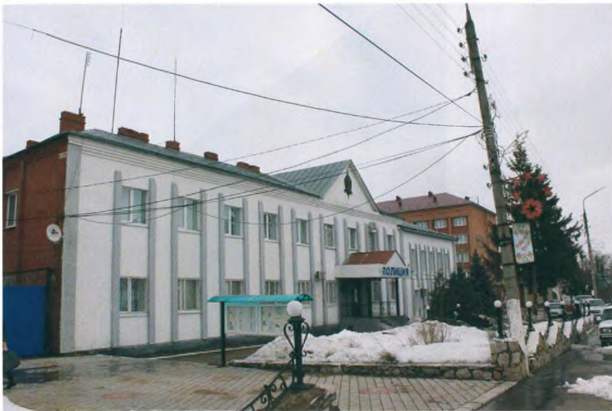
Вид на здание РОВД со стороны ул. Советская