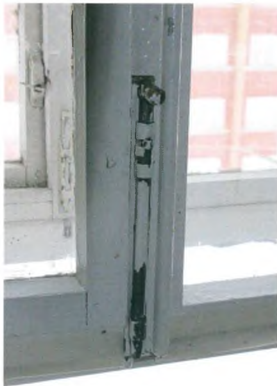
Скобяные изделия на поздних деревянных окнах