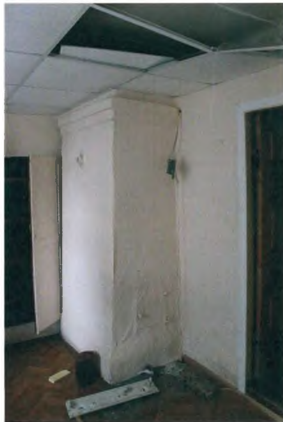
Беленая печь в помещении №53 второго этажа здания