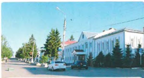
Улица Советская в 1970-е годы