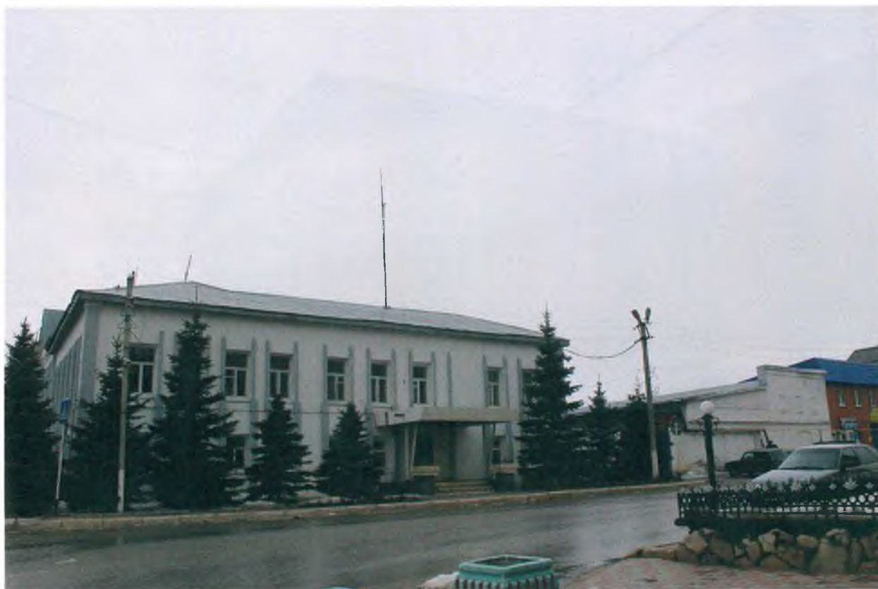
Вид на здание РОВД со стороны ул. Толстого