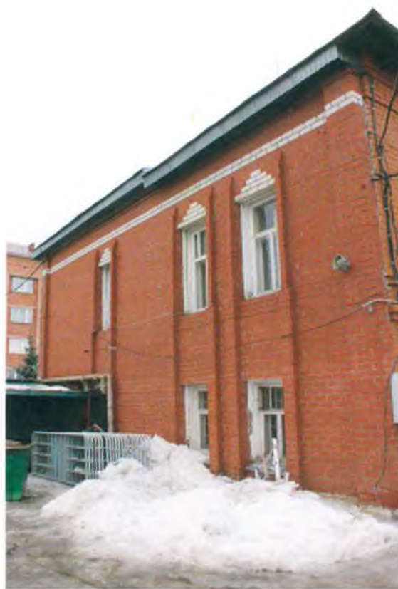
Прижимная кирпичная стенка бокового фасада