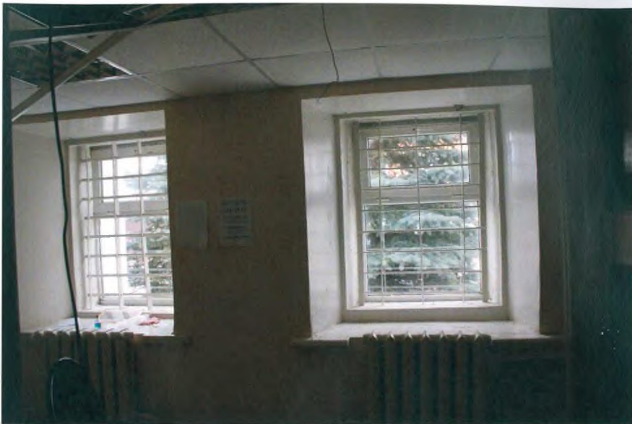
Пластиковые окна первого этажа фасада по ул. Толстого