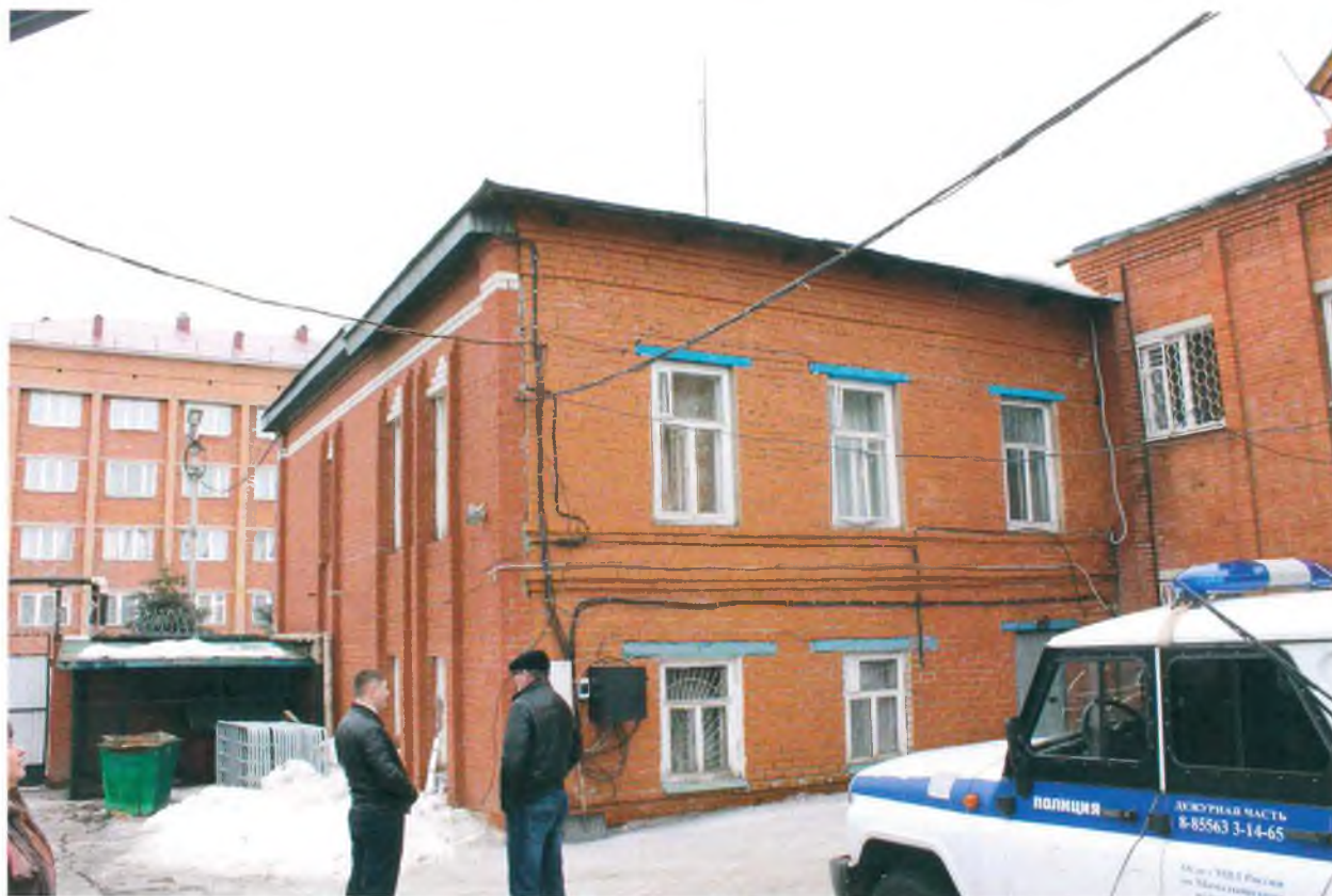
Переложенная лицевая верста дворового фасада