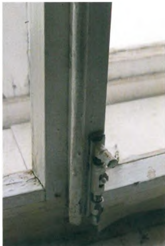
Скобяные изделия на поздних деревянных окнах