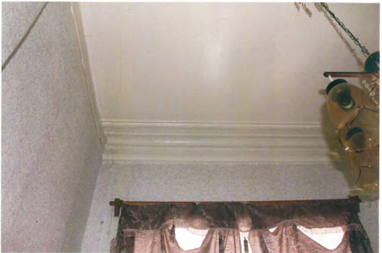
Сохранившаяся потолочная тяга и поздняя перегородка в помещении второго этажа