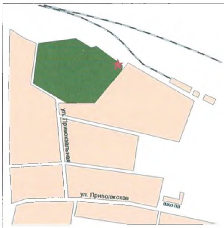
Схема расположения Объекта – «Захоронения советских воинов, умерших от ран в 1941-1945 гг. в эвакогоспиталях г. Казани. Пос. Красная Горка», расположенного по адресу: Республика Татарстан, г. Казань, Кировский район, кладбище бывш. пос. Красная Горка, (пос. Юдино, ул. Привокзальная)