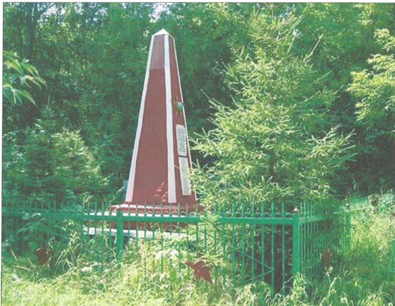
Республика Татарстан, г. Казань, Кировский район, кладбище бывш. пос. Красная Горка, (пос. Юдино, ул. Привокзальная) Стела на захоронении воинов, умерших от ран в эвакогоспиталях. Фото 2010-х годов. Общий вид