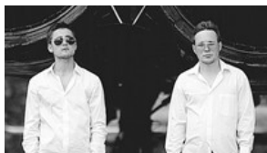
Чувашская группа ЏИЛАРМАН Россия, г. Чебоксары