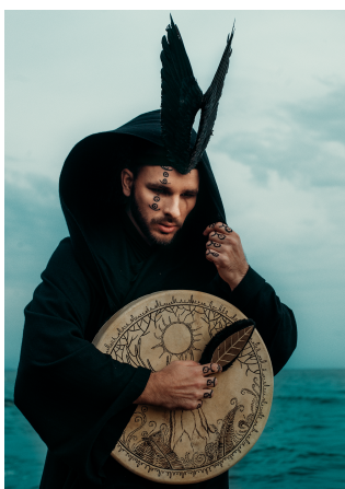
GURUDE Россия, Республика Хакасия