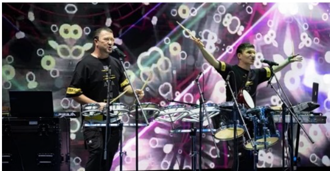
АБИЕМ Project, Россия, г. Альметьевск

место проведения: Казанский Кремль, Пушечный двор