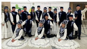
Ансамбль песни и танца «Алабуга» Россия, г. Нижнекамск