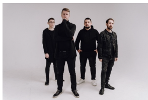
Группа ЖИВаГО Россия, г. Казань