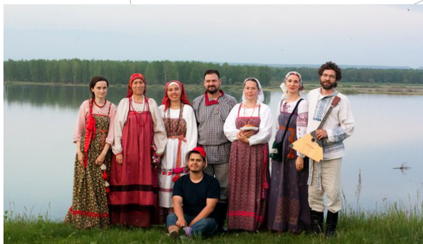
Фольклорный коллектив «Не любо-не слушай» Россия, г. Казань

место проведения: Казанский Кремль, Пушечный двор