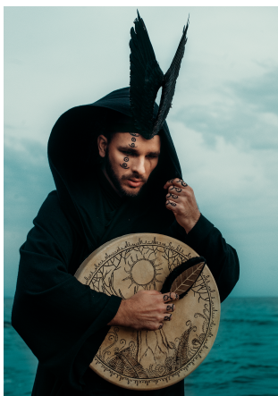
GURUDE Россия, Республика Хакасия